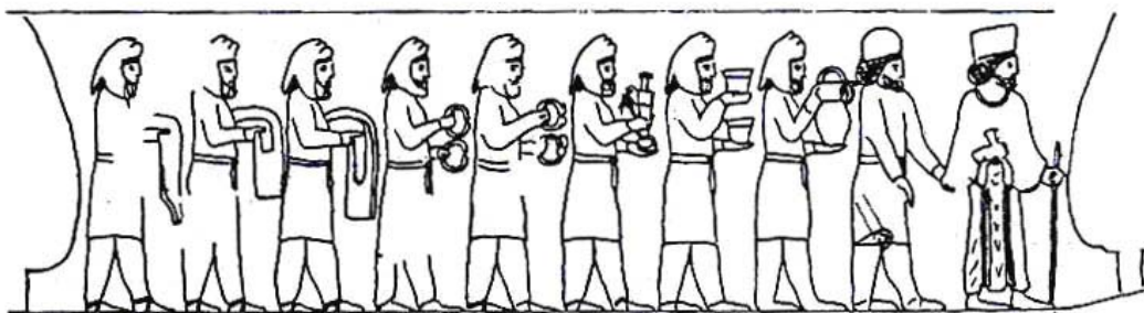
هیأت نمایندگی مادها در سنگ‌نگاره‌های تخت جمشید با محموله‌های انگبین و زعفران

زعفران در دوره ساسانیان علاوه بر مصارف خوراکی، درمانی و آرایشی برای رنگ کردن الیاف جامه (پشم، پنبه، ابریشم و موی) کاربرد داشته که در بندهش و بندهش هندی به آن اشاره شده است. ۴۶ همچنین بر محصول زعفران خراج و مالیات تعلق می‌گرفته، بطوری که در سده ۱ ق/ ۷م، اسپهد مازندران پس از شکست از یزیدبن مهلب از جمله به پرداخت ۴۰۰ خروار زعفران، و به روایت بلاذری ۴۰۰ بار شتر موظف می‌شود ۴۷ ، که این مقدار (با توجه به مقادیر مختلف «خروار» در قدیم) حداقل ۳۰ و حداکثر ۶۰ تن بوده است. منصوردوانیقی خلیفه عباسی (خلافت ۱۳۶-۱۴۹ ق/ ۷۵۳-۷۶۶ م) میزان مالیات محصول مازندران را به روال عهد ساسانیان (اکاسره) سالانه ۱۰ خروار زعفران تعیین می‌کند. ۴۸